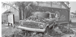
ソレイユの丘 長井ベースではアメ車がお出迎え

2023年4月にリニューアルオープンしたソレイユの丘。テレビで見たという方も多かったのではないのでしょうか。