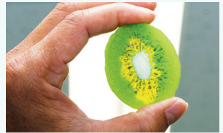
キウイの中心部分の微妙な色の変化や小さな種も忠実に再現していた。

ここで、OEMだけでなく、自社製品を開発することにした。OEM製品を作る中、スタッフの技術は飛躍的に向上していた。マーケティングを重ね、モチーフは色も形も大きさも様々でかわいいフルーツに決めた。「liliii(リイリイ)®」ブランドの誕生である。