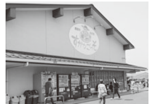
すかなごっそ。広い駐車場あり。

長井水産から国道134号線に戻り、次に向かったのはJA直営の大型農産物直売所「すかなごっそ」。平日でも午後は売り切れが多くなってしまおうという人気店です。店内は色とりどりの新鮮な