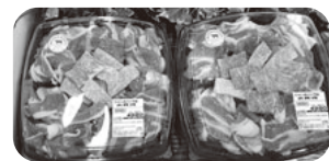
野菜だけでなく大盛りのお肉もあります