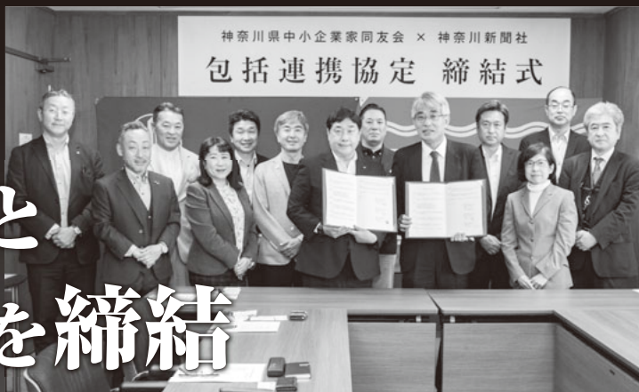
包括連携協定 締結式に参加された皆様

2023年5月12日に神奈川中小企業センタービルにて、神奈川新聞社と神奈川県中小企業家同友会との包括連携協定締結式が行われました。