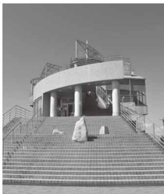
高麗山公園レストハウス展望台

神奈川で青春時代を過ごした人であれば、行ったことがある人も多いだろう、恋人たちの聖地 湘南平。標高約180メートルの高台にあり、高麗山公園レストハウス展望台からはぐるっと360度、相模湾から富士山まで見渡せ、壮大な景観が楽しめます。