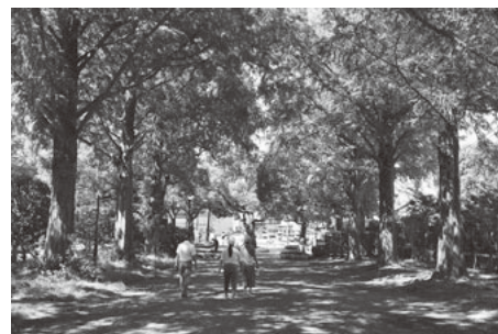
メタセコイア並木はとにかく気持ちいい！

メタセコイア並木のすぐ近くにはスラムダンクで有名な「平塚総合体育館」があります。決勝リーグで陵南戦の舞台となった体育館のモデルとなった場所。訪れてみたい聖地巡礼人気スポットです。