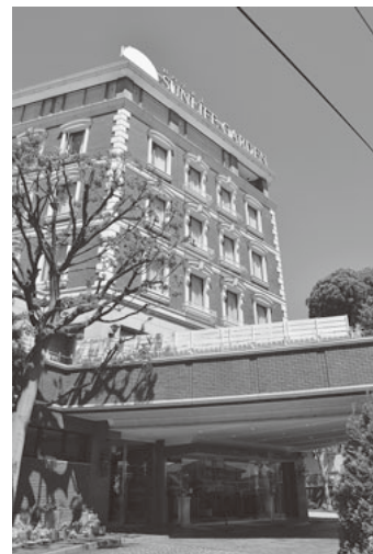
かなカン会場の入口はこちら

かなカン会場は、相模川沿いに建つ歴史ある「ホテルサンライフガーデン」です。赤いレンガ作りの本館と英国より移築したチャペル棟があり、庭には約100品種、300本弱のバラが植えられています。