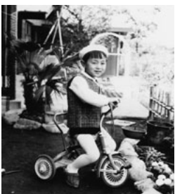
3歳9か月。鶴見の自宅庭にて。