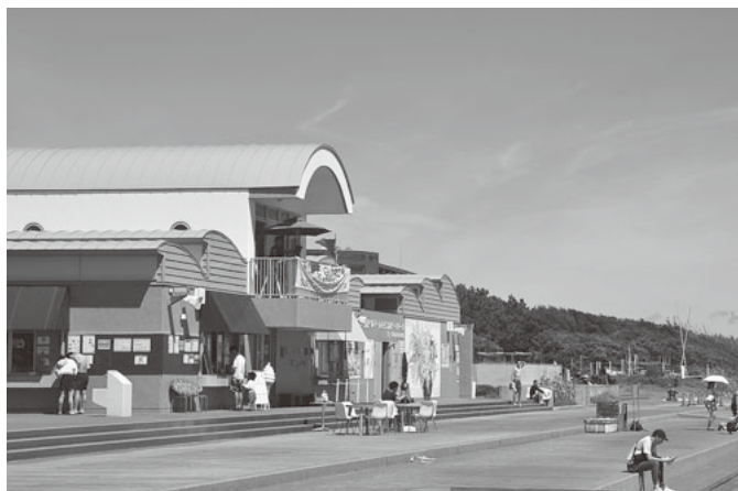
海沿いに約1km続く散歩遊歩道ボードウォーク

「波打ち際から5秒の食卓」がコンセプトの「ビーチバルSUCCA」は、ビーチサイドにあるカジュアルレストラン。ここでは、海を眺めながら地魚を使った料理を楽しむこともできます。