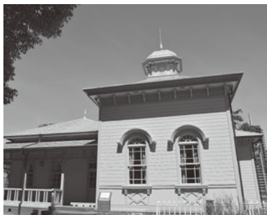
明治時代の風情が漂う会議室もお勧め

平塚駅から徒歩10分ほどのところにある平塚八幡宮。その西側に旧横浜ゴム平塚製造所から移築された八幡山の洋館があります。明治期の木造建築物で外観はピンク！中に入るとアールヌーボー様式の部屋の美しさのため息がもれます。庭に植えられた美しいバラも有名で、現在は会議室やレンタルスペースとして利用できます。