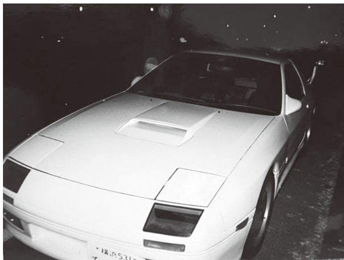
一番最初に輸出した中古車は愛車のRX-7

そんなとき、たまたまドミニカ共和国在住の日本人の方から中古車輸出について問い合わせがあり、最後の賭けのつもりで現地まで行きました。中古車の輸出にはつながらなかったのですが、現地で日本車の中古部品のマーケットが盛況であることを知りました。それで、先ほどの日本人の人と話しして、私が中古パーツを仕入れてその人が見つけた地元の業者へ卸す、とい