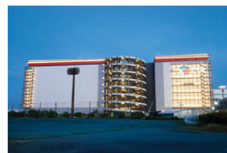
海と反対側にある倉庫街もライトアップが美しい

連れで散歩をする人に出会うこともあり、人工的な街のイメージですが、人の生活も垣間見えます。