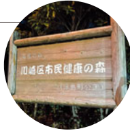
浮島公園の入り口

ビジネスでないと足を踏み入れないエリアではないかと思う川崎臨海部ですが、飛行機好きにはたまらない公園があります。