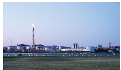
ENEOSの工場や石油タンクが立ち並ぶ

川崎マリエンから車で3分ほどの場所に東扇島公園があります。運河の入り口に面した公園