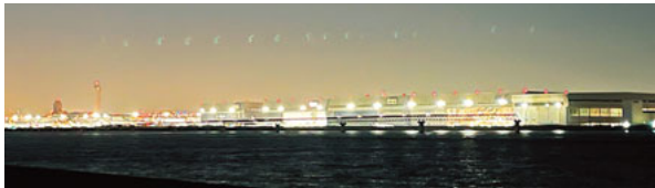
きらきらと輝く羽田空港

公園自体が比較的暗いので、飛行機を眺めるのには最適なのですが、お足元にはご注意ください。