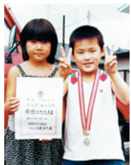
柔道小学2年生の部 準優勝。姉と共に。

趣味は、筋トレと登山。同友会では、今年度から社員教育委員長に就任している。少子化が進む中、若い人に入社してもらうことが自社にとっても大きな課題だと語る。間違いなく、今後の発展が楽しみな会社の一つになっている。